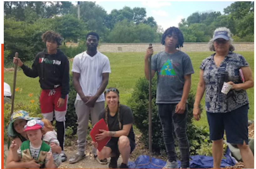
Familias del vecindario tomando una foto grupal después de una tarde de voluntariado a través de Friends of Valley Park.

Nuestra frontera sur es la I-94. Al oeste de nosotros está el río Menomonee. Al norte de nosotros está la planta de MillerCoors. Esto significa que nuestras calles son casi todos callejones sin salida. Es un rinconcito tranquilo que muchos en la ciudad desconocen. Me encuentro con residentes todo el tiempo que dicen que eligieron vivir aquí para proteger a su familia de las luchas que enfrentan muchos