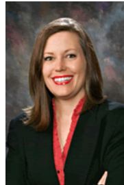
Sen. Katie Hobbs (D-24)