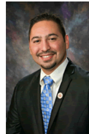
Sen. Martin Quezada (D-29)