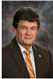
Sen. David Bradley (D-10)