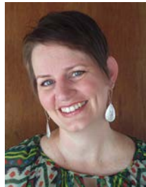
Rep. Celeste Plumlee (D-26)