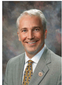
Rep. Randall Friese (D-9)