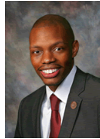
Rep. Reginald Bolding (D-27)