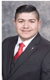
Rep. Jesus Rubalcava (D-4)