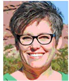
Sen. Katie Hobbs (D-24)