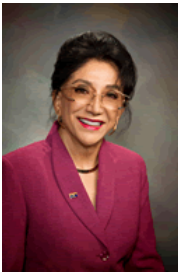
Sen. Olivia Cajero Bedford (D-3)