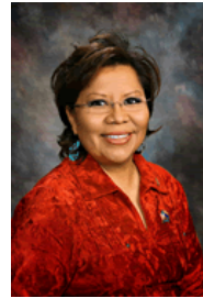
Sen. Jamescita Peshlakai (D-7)