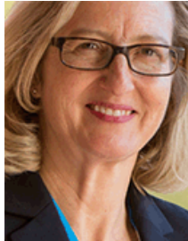
Rep. Kirsten Engel (D-10)